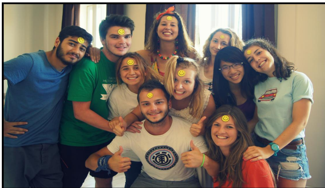
Wolontariusze workcampu w Długosiodle.