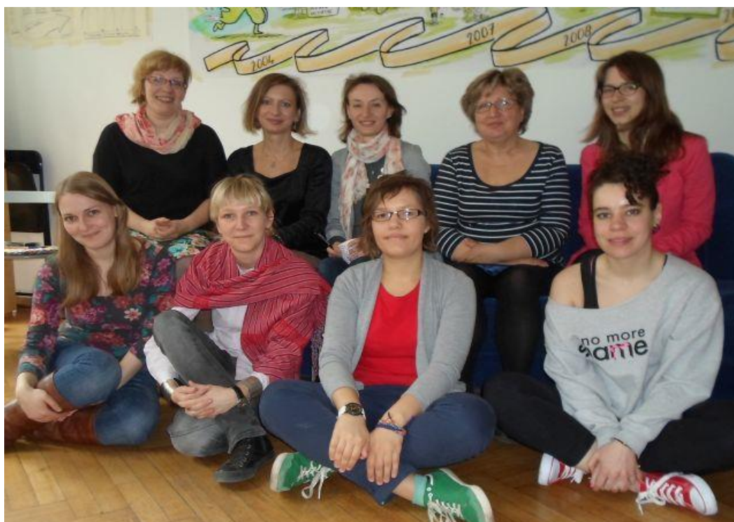
Wolontariuszki (zarządczyni, koordynarorki, komisja rewizyjna).